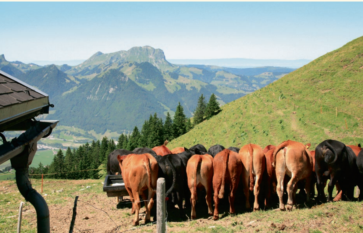
Fleischrinder an der 40°C warmen Molken tränke unmittelbar nach der Fabrikation von Alp-Gruyère AOP auf der Alp Vacheresse auf 1600 m ü.M, Kanton Freiburg.

Auskünfte: Pierre-Alain Dufey, E-Mail: pierre-alain.dufey@agroscope.admin.ch