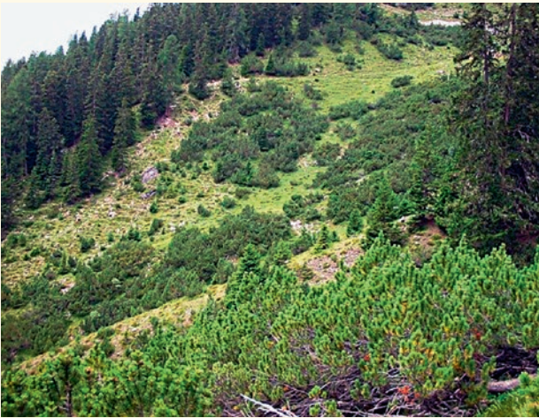
Abb. 2 | Verwaldung einer Bergweide.

dukt der Lebensmittelherstellung sinnvoll verwertet wird und gleichzeitig zur langfristigen Erhaltung der Alpbetriebe und einer nachhaltigen Produktion bei 100 % Swissness beiträgt?