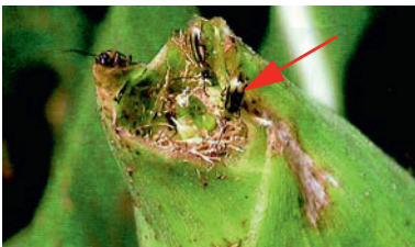
soies rongées par les adultes