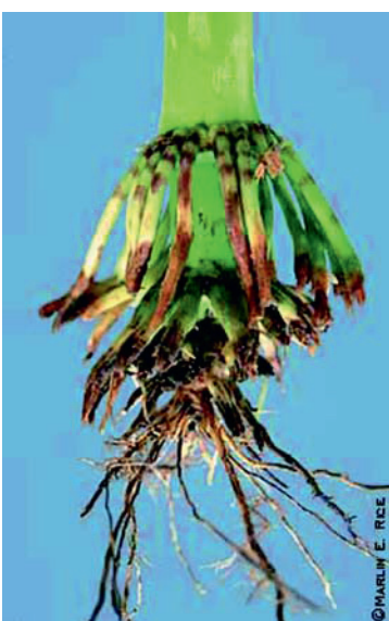
racines rongées par les larves

L'adulte (5 mm) peut voler sur de grandes distances pour rechercher un maïs aux soies appétissantes (maïs en floraison). La femelle dépose alors ses oeufs dans le sol et ce n'est que le printemps suivant que ceux-ci donnent naissance à de petites larves. Celles-ci ne peuvent se développer que si elles y trouvent des racines de maïs. La larve (~ 12 mm) termine son développement en juillet, se nymphose et l'adulte sort de terre et recommence le cycle. Il n'y a qu'une génération par année mais l'insecte a besoin de deux années successives de maïs sur la même parcelle pour pouvoir accomplir son développement.