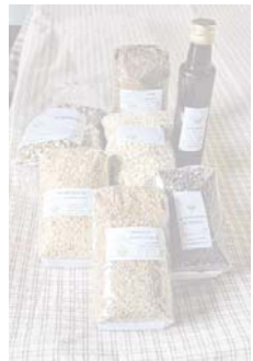
Une installation de tri sur la ferme est particulièrement adaptée lorsqu'une grande diversité de produits est proposée.