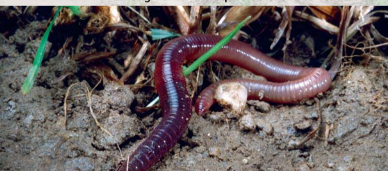
Regenwürmer: Pflüger im Untergrund

Un lit de semences trop fin augmente les risques de battance et d'érosion