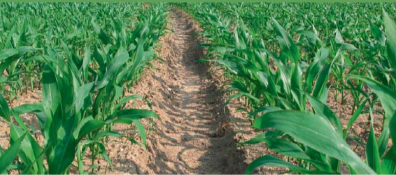
Fahrten im nassen Boden hinterlassen Verdichtung

«Une production végétale qui va au fond des choses»