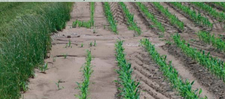
Zu feines Saatbett erhöht das Risiko für Verschlammung und Erosion

L'épandage du lisier à l'aide de tuyaux souples exerce une pression minimale sur le sol