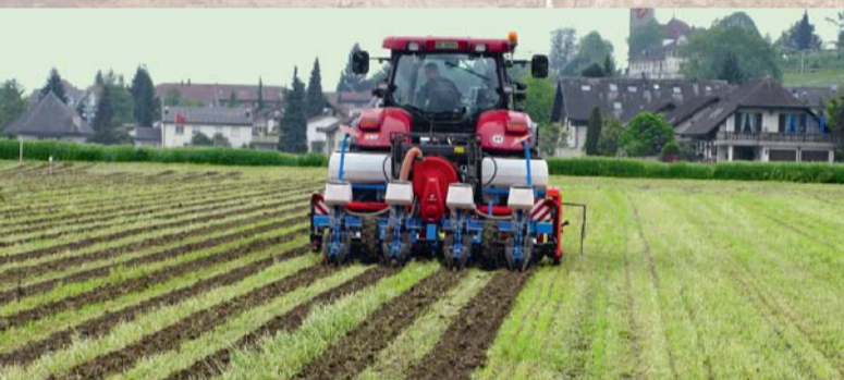
Gute Tragfähigkeit und Erosionsschutz mit Streifenfrässaat

Sol brun lessivé profond: un type de sol pour des terres assolées fertiles