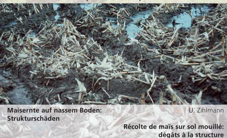
Maisernte auf nassem Boden: Strukturschäden

Le semis en bandes fraisées offre une bonne portance et une protection contre l'érosion