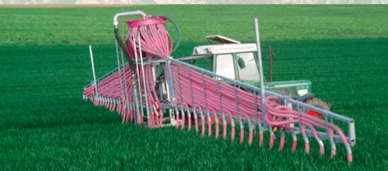
Schleppschlauchverteiler: Das Güllefass bleibt am Feldrand

Des passages de machines sur un sol non ressuyé provoquent un tassement